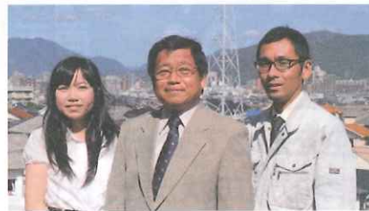
おひとりおひとり様に全力投球のスタッフ

屋が見られます。まだまだ豊かな時代でないのに大きな梁組や太い柱を要所に採用しています。そして長い年月を過ぎて今あることを思い、ひのきで建てる「純真無垢の家」は材寸4寸角の梁柱が狭小地に建つ家でもこだわりを支えてくれる標準仕様となりました。