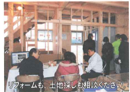
リフォームも、土地探しも相談ください。