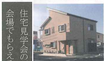
狭小地に建つ南区段原 純真無垢の家 の完成例

住宅見学会のご案内は、ウラ面をご覧ください、会場でもらえる「来場者様特典は」こちら↓