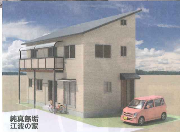
純真無垢 江波の家